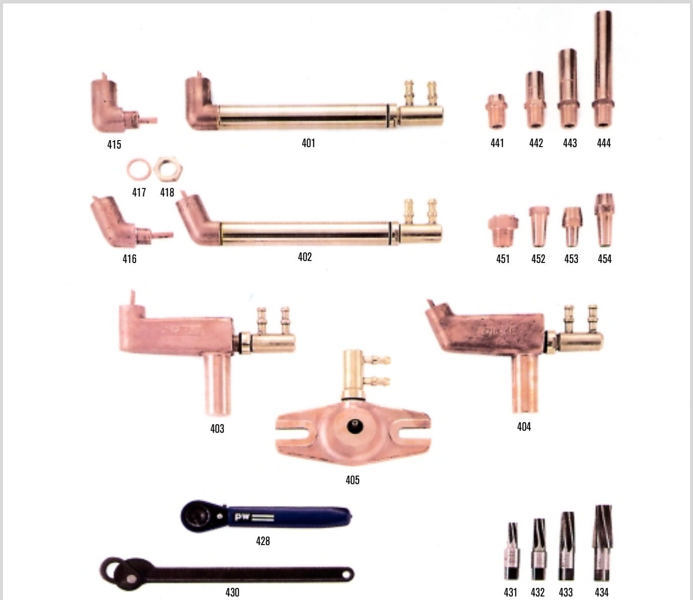
Bild-Nummer Elektrodenhalter und Zubehör